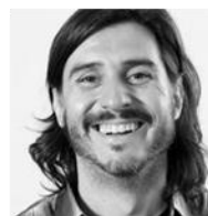
#9 CHACHO PUEBLA LOLA MULLENLOWE 24 menciones