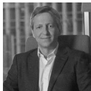
#1 RAFAEL URBANO YMEDIA VIZEUM 23 menciones