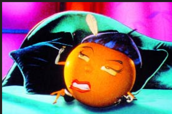
THE RADICAL FRUIT Co - TV

● Agencia: Tiempo BBDO Anunciante: Compañía de Bebidas Pepsico Producto: Refresco Marca: The Radical Fruit Co. Director creativo: Luis Asenjo Productora: Tesauro Realizador: Víctor García Pieza: Spot Título: "Lemon"