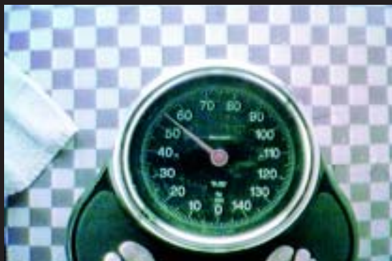
AUDI - TV

Agencia: Tandem Campmany Guasch DDB Anunciante: Volkswagen Audi Producto: Automóvil Marca: Audi A4 Directores creativos: Daniel Ilario y Alberto Astorga Productora: Pirámide Realizador: Nacho Gayán Pieza: Spot Título: "Sueños"