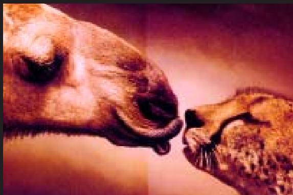
AUDI - TV