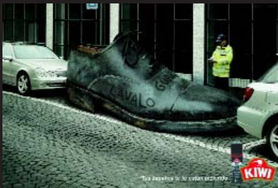
KIWI - GRÁFICA

● Agencia: La Comunidad Anunciante: MTV Producto: Canal musical Marca: MTV Productora: Wasabi Films Pieza: Tres spots Título: "Huele a Britney", "Peluquería" y "Bebé"