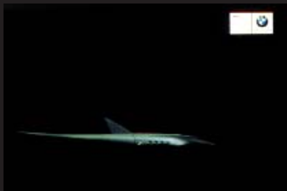
BMW - GRÁFICA

Agencia: Tandem Campmany Guasch DDB Anunciante: Volkswagen Audi Producto: Automóvil Marca: Audi A4 Directores creativos: Daniel Ilario y Alberto Astorga Productora: Pirámide Realizador: Nacho Gayán Pieza: Spot Título: "Sueños"