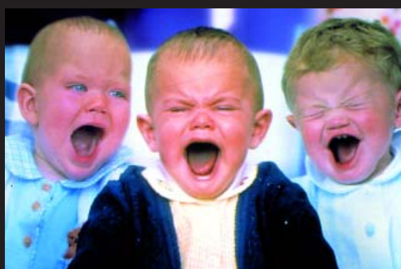
PEPSI - TV

● Agencia: Tiempo BBDO Anunciante: Compañía de Bebidas Pepsico Producto: Refresco Marca: Pepsi Director creativo y redactor: Miguel García Vizcaíno Productora: Tesauro Realizador: Víctor García Pieza: Spot Título: "Babies"