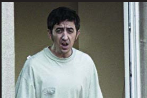
EUSKALTEL - TV

● Agencia: Dimensión Anunciante: Euskaltel Producto: Llamadas metropolitanas Marca: Euskaltel Director creativo ejecutivo: Guillermo Viglione Director creativo: Mikel Aguado Productora: La Gloria Realizador: Miquel Alcarria Pieza: Spot Título: "Patxi"