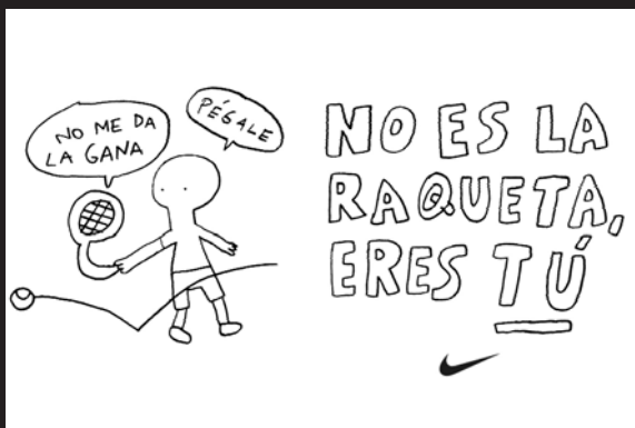
NIKE - GRÁFICA

● Agencia: Dimensión Anunciante: Euskaltel Producto: Llamadas metropolitanas Marca: Euskaltel Director creativo ejecutivo: Guillermo Viglione Director creativo: Mikel Aguado Productora: La Gloria Realizador: Miquel Alcarria Pieza: Spot Título: "Patxi"