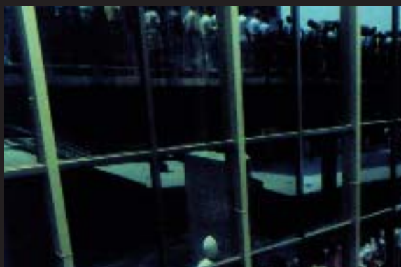
ONCE - TV

Agencia: Slogan Anunciante: Once Producto: Cupón Marca: Once Equipo creativo: El Sindicato Productora: Ovideo Realizadores: Paco Mir, Javier Veiga y El Sindicato Pieza: Spots Título: "Chalé", "Agencia de viajes", etcetera.