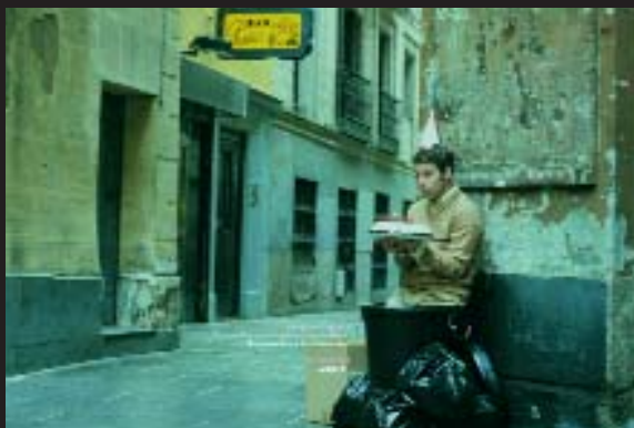
SONY - GRÁFICA

● Agencia: SCPF Anunciante: BMW Producto: Campaña de imagen Marca: BMW Directores creativos: Toni Segarra y Rafael Montilla Productora: MJZ Realizador: Víctor García Pieza: Spot Título: "Mano"