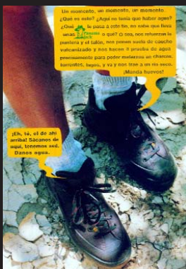
PANAMÁ JACK - GRÁFICA

Agencia: Slogan Anunciante: Once Producto: Cupón Marca: Once Equipo creativo: El Sindicato Productora: Ovideo Realizadores: Paco Mir, Javier Veiga y El Sindicato Pieza: Spots Título: "Chalé", "Agencia de viajes", etcetera.