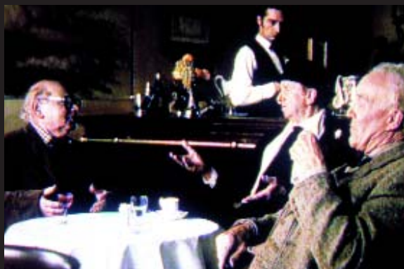
AUDI A4 - TV