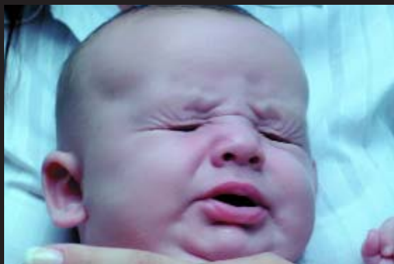
MTV - TV

● Agencia: La Comunidad Anunciante: MTV Producto: Canal musical Marca: MTV Productora: Wasabi Films Pieza: Tres spots Título: "Huele a Britney", "Peluquería" y "Bebé"