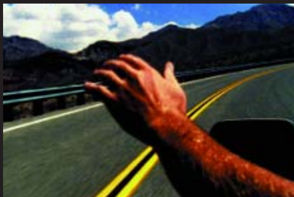
BMW - TV

● Agencia: SCPF Anunciante: BMW Producto: Campaña de imagen Marca: BMW Directores creativos: Toni Segarra y Rafael Montilla Productora: MJZ Realizador: Víctor García Pieza: Spot Título: "Mano"